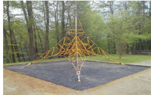
8 m x 8 m

Le circuit sera installé sur un sol sécurisé nid d'abeille, même sol que la pyramide de cordes présentée sur la droite. Les photos représentent un aperçu général du projet. Une table de ping-pong et un toboggan seront également installés